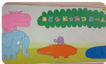
こども発達ルームは2階にあります