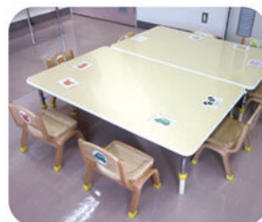
グループのお部屋